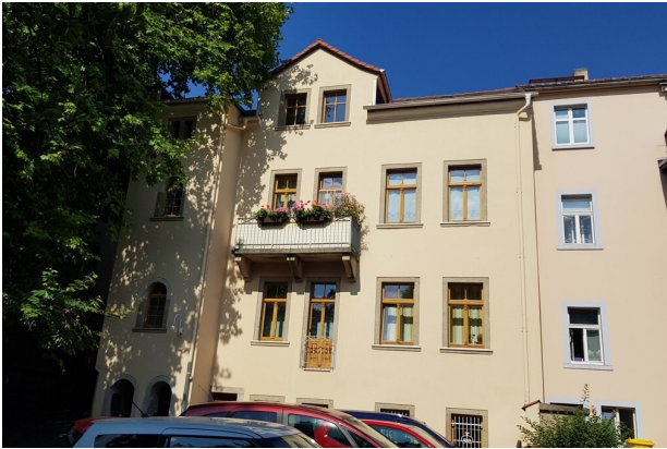
Ansicht vom Hof