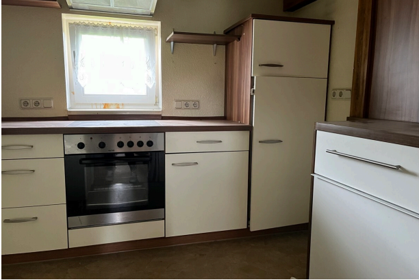
Küche im OG